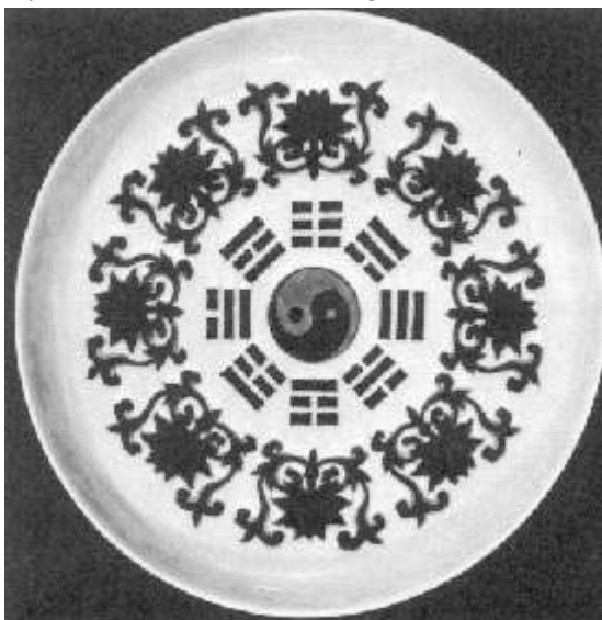
Pa Kua (Ch'ing dynastie ±1750)

Acupuncture, a comprehensive text p. 4) In de Pa Kua, op de volgende pagina afgebeeld (Ch'ing dynastie ±1750), wordt de monade omringd door 8 trigrammen, die elk weer zijn samengesteld uit drie balken. Hele balken, die het Yang symboliseren en gebroken balken die het Yin symboliseren. Zo zijn er dus acht verschillende combinaties mogelijk, die ieder verschillende invloeden hebben op de mens, die hierin het midden, als het Yin- Yang teken staat afgebeeld. Hij plaatste de mens als een wezen dat tussen hemel en aarde staat en symboliseerde dit in een trigram. In de Pa Koua voegde hij de verschillende elementen en