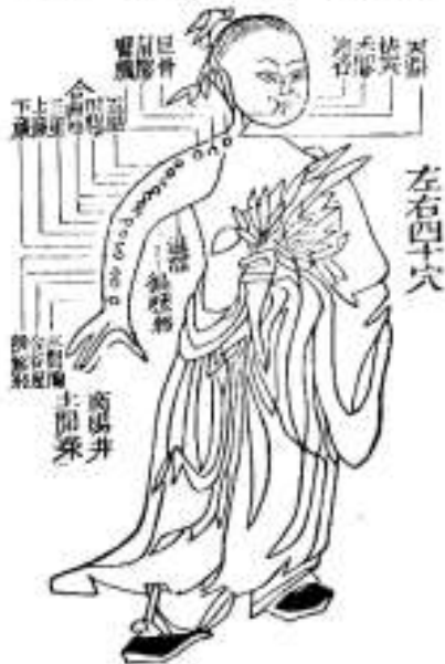
Dikke darm meridiaan